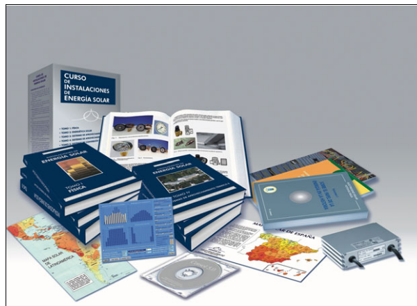
Material del curso de Projectista Instalador.

Folleto informativo en www.fotovoltaica.com/folpvsun.pdf